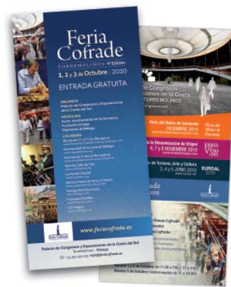
Flyer Promocional Feria Cofrade 2010. 30.000 ejemplares

Feria Cofrade, cuenta con el soporte de internet en www.feriacofrade.es con el doble objetivo de servir de fuente de consulta informativa permanente y llegar al mayor número posible de países del mundo durante los 365 días del año, ya que la religiosidad popular y el fenómeno cofrade se expande por varios continentes.